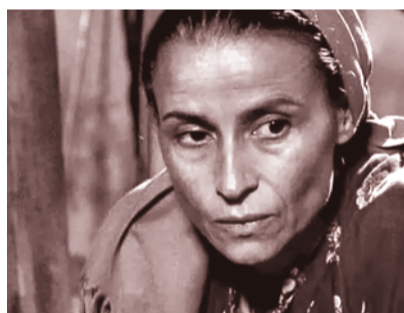
Fotograma del dim «Benzine».

Davant la proliferació de discursos alarmistes i l'extensió de les visions que problematitzen el fet de migrar, es proposa explicar que el «problema» que tenim son les fronteres, les lleis discriminatòries i el racisme, i no les persones. Volem reivindicar el dret de tota