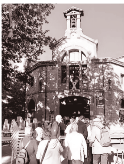
Festa de l'any passat, a Alenyà.

Després de l'esmorzar, a les 11.30, h està programat l'espectacle de dansa Andare , de la companyia Impàs Dansa.