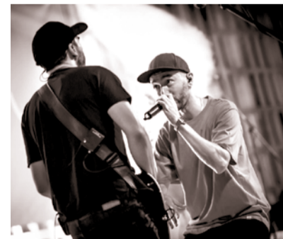
Figa Flawas actuarà la nit del dia 3.

A banda de la presència d'efectius dels Mossos d'Esquadra i dels vigilants municipals, també s'ha contractat vigilància privada a