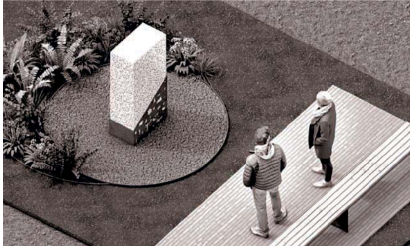
La imatge, del projecte de l'arquitecte Albert Jané, mostra una simulació o renderització del nou espai.

Al voltant d'aquest espai hi haurà diferents plantes decoratives, una zona d'estada amb un banc i una placa informativa.